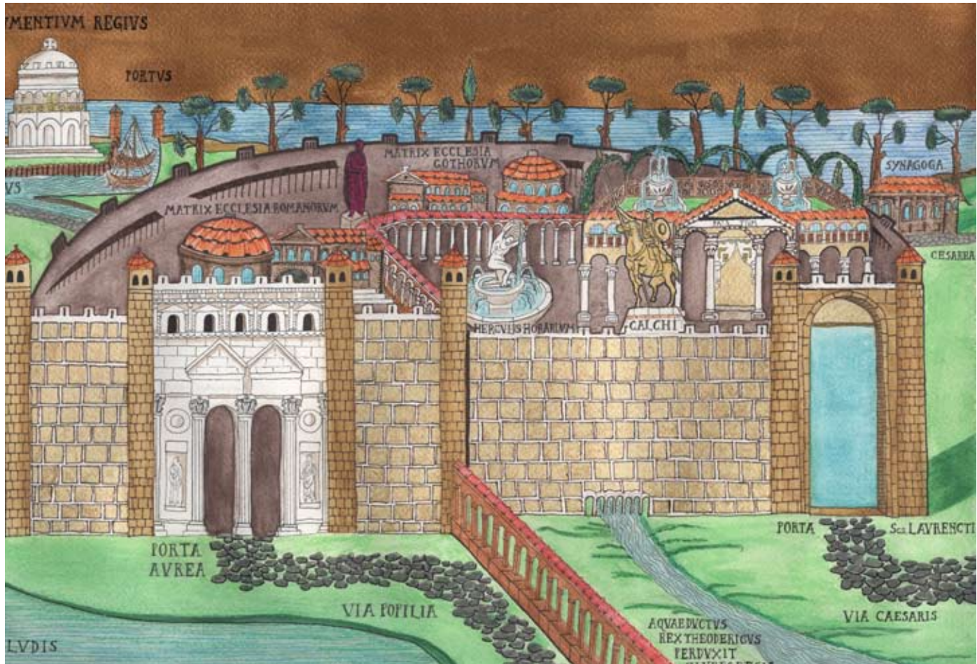
Ravenna Felix- Capitale del regno di teodorico, V, VI sec disegni di F. Franchini